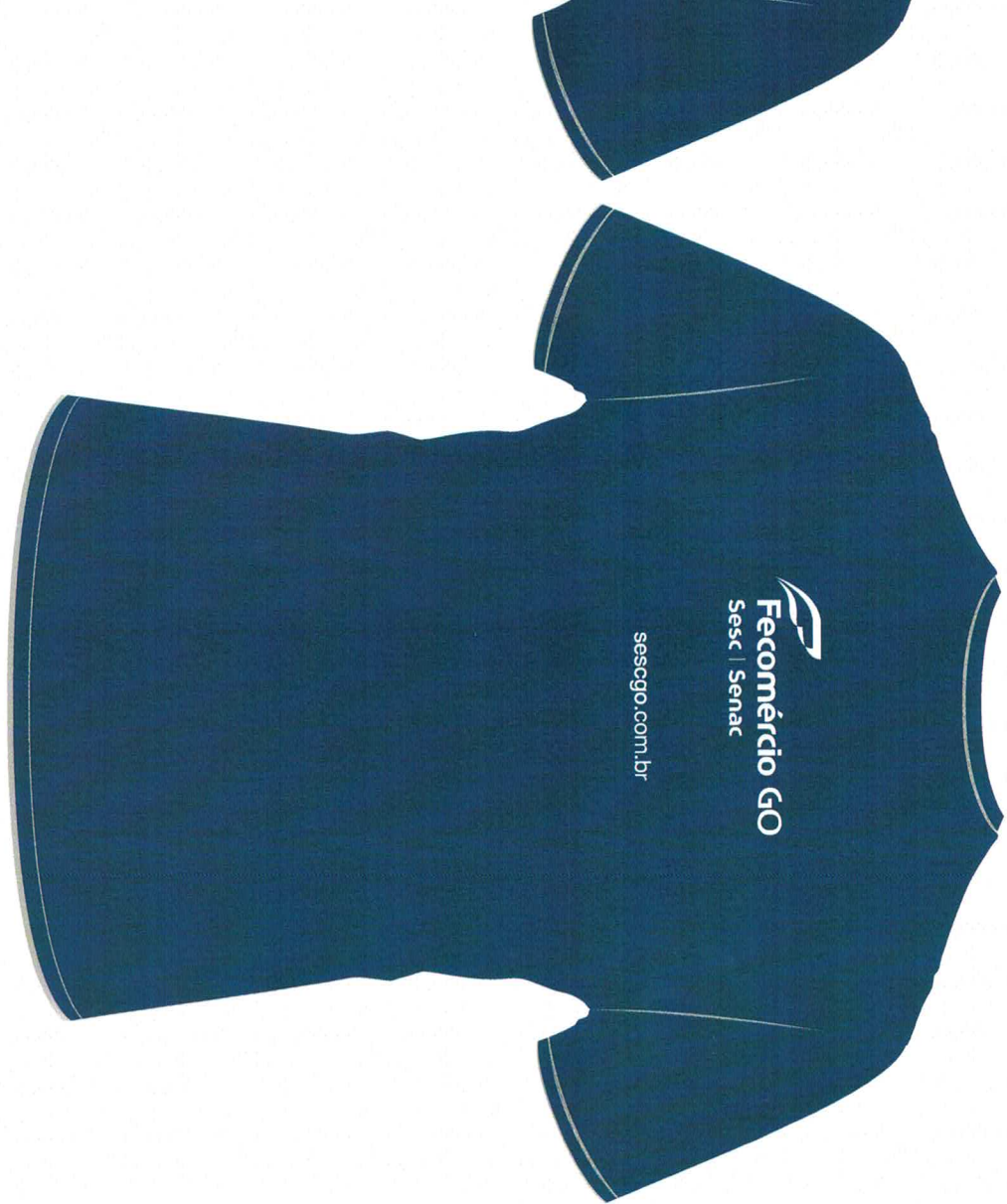
Camiseta institucional PV (poliviscose) azul marinho Serigrafia 1 cor