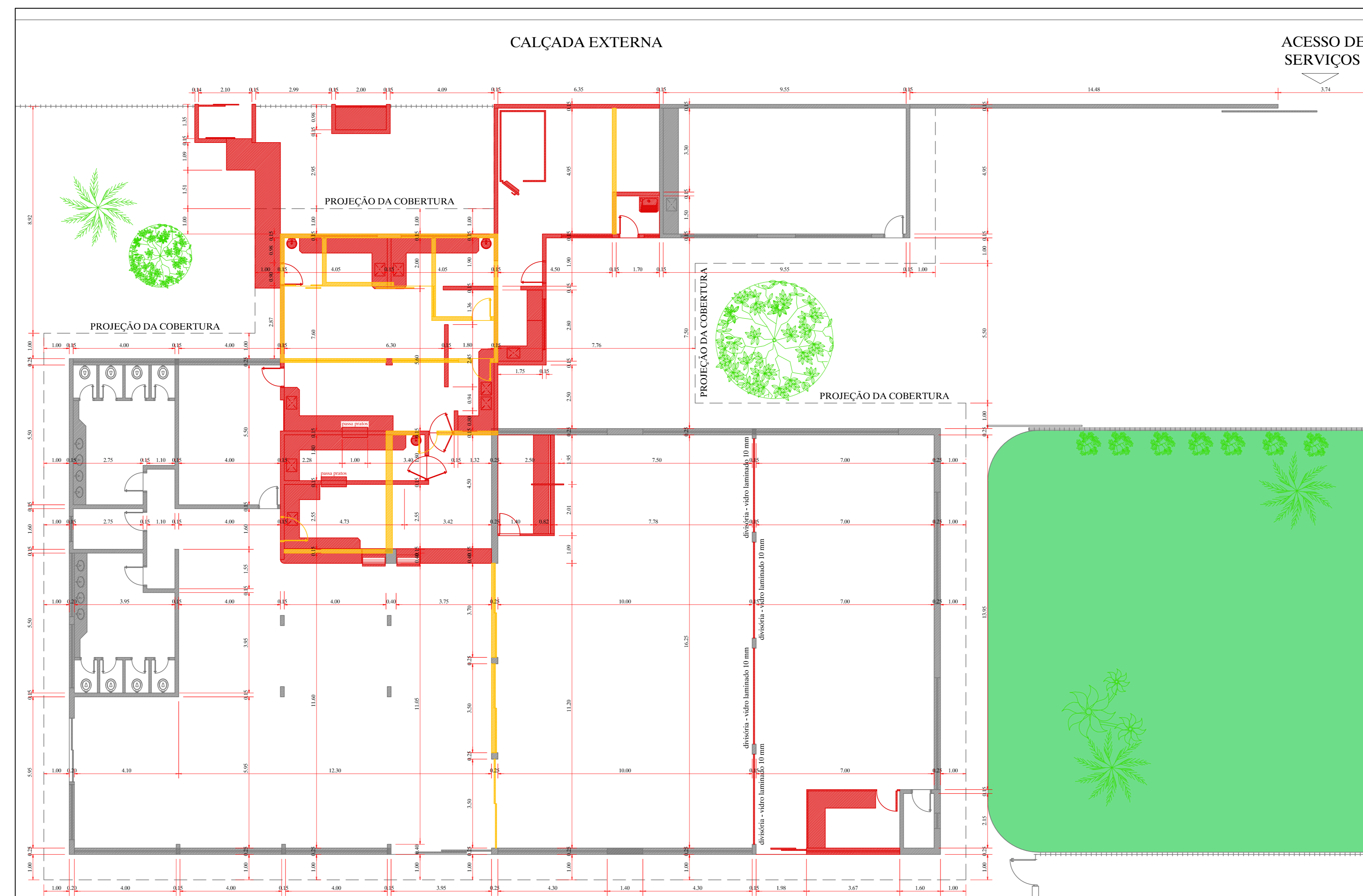
CONSTRUIR/DEMOLIR LANÇONETE E COZINHA ESC 1/100